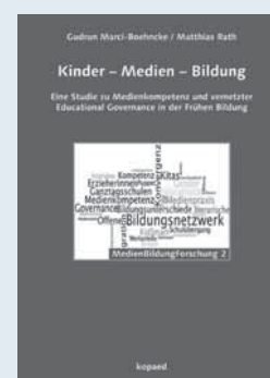
Gudrun Marci-Boehncke/ Matthias Rath: Kinder – Medien – Bildung. Eine Studie zu Medienkompetenz und vernetzter Educational Governance in der Frühen Bildung. München 2013: kopaed. 260 Seiten, 18,80 Euro