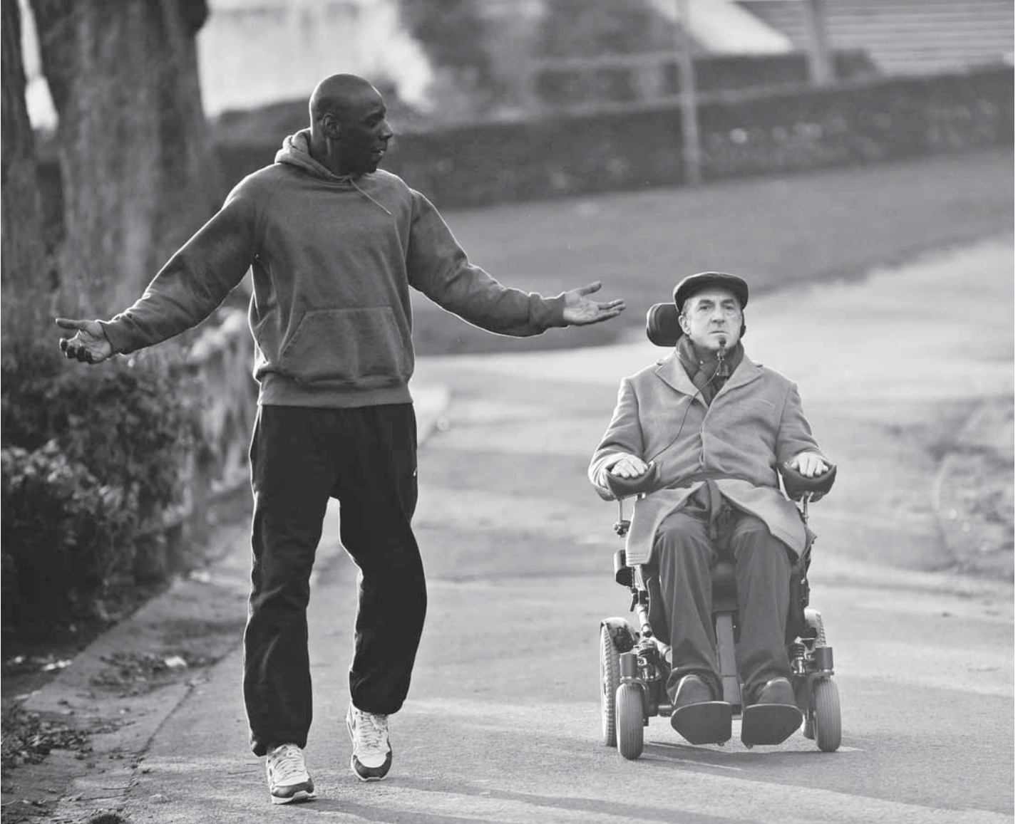
Ziemlich beste Freunde