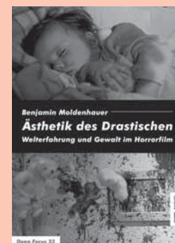
Benjamin Moldenhauer: Ästhetik des Drastischen. Welterfahrung und Gewalt im Horrorfilm. Berlin 2016: Bertz + Fischer. 358 Seiten, 25,00 Euro