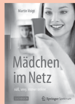
Martin Voigt: Mädchen im Netz. Süß, sexy, immer online. Berlin/Heidelberg 2016: Springer Spektrum. 228 Seiten, 14,99 Euro